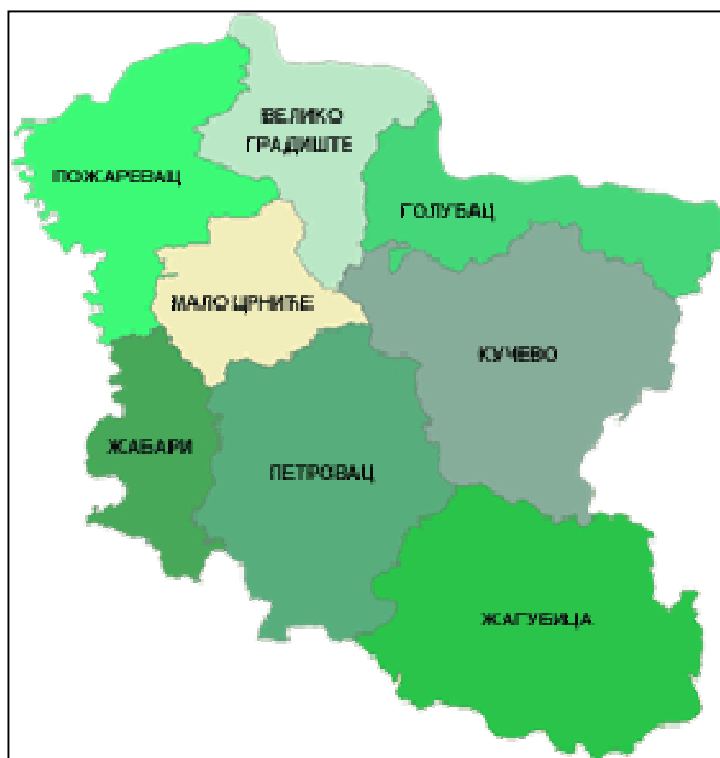
Слика 1: Географски положај Града Пожаревца

Ваздушни саобраћај није развијен на територији града Пожаревца, а најближи аеродром је “Никола Тесла” у Београду, на удаљености од 80км.